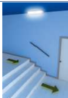
Lampada di emergenza