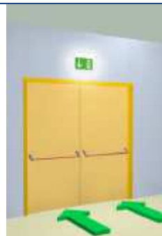
Lampada di segnalazione

La regolare manutenzione dell'impianto di illuminazione e dei singoli apparecchi di emergenza è fondamentale per assicurarne la perfetta funzionalità nel momento del bisogno.